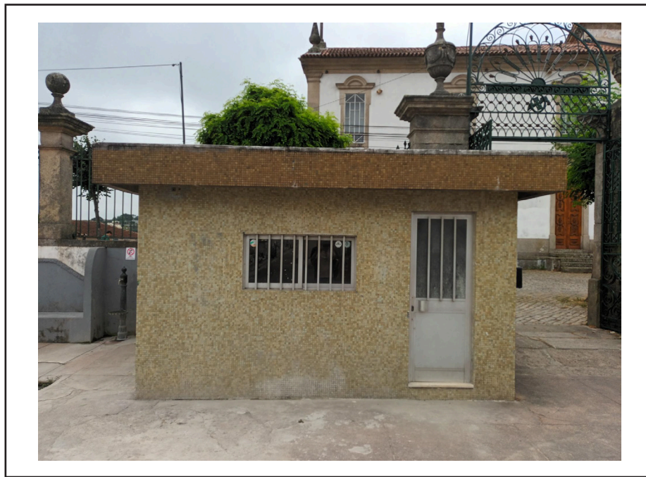
1 - Fotografia do objeto da Hasta pública